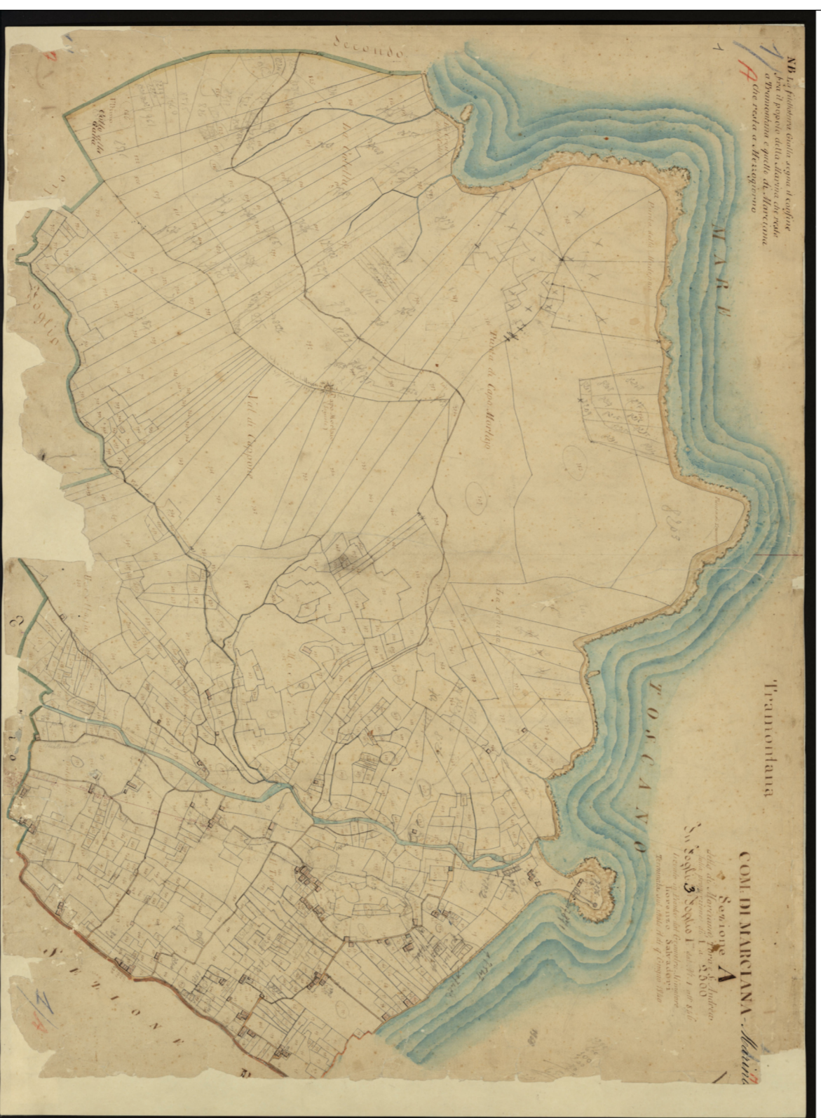
Marciana Marina, Carato Leopoldino del 1840. Sez. A, F. 1 - Progetto CASTONE Regione Toscana e Archivi di Stato toscani