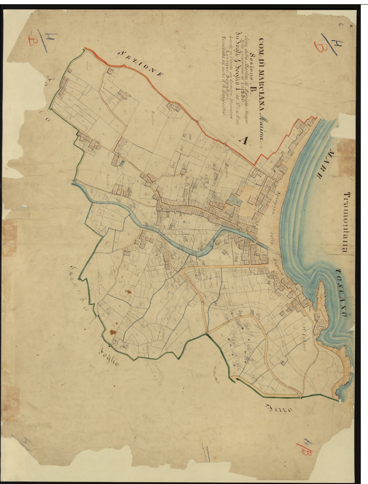
Marciana Marina, Carato Leopoldino del 1840. Sez. B, F. 1 - Progetto CASTONE Regione Toscana e Archivi di Stato toscani